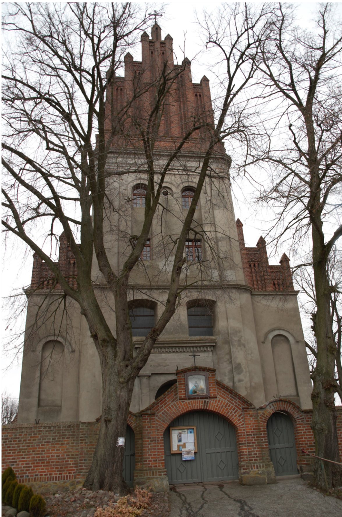
(Zespół klasztorny Zgromadzenia Sióstr Miłosierdzia św. Wincentego a Paulo w Bysławku)